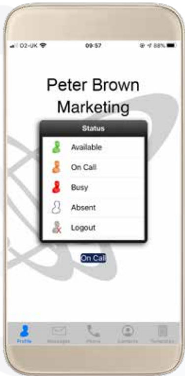
Multitone Appear en smartphone